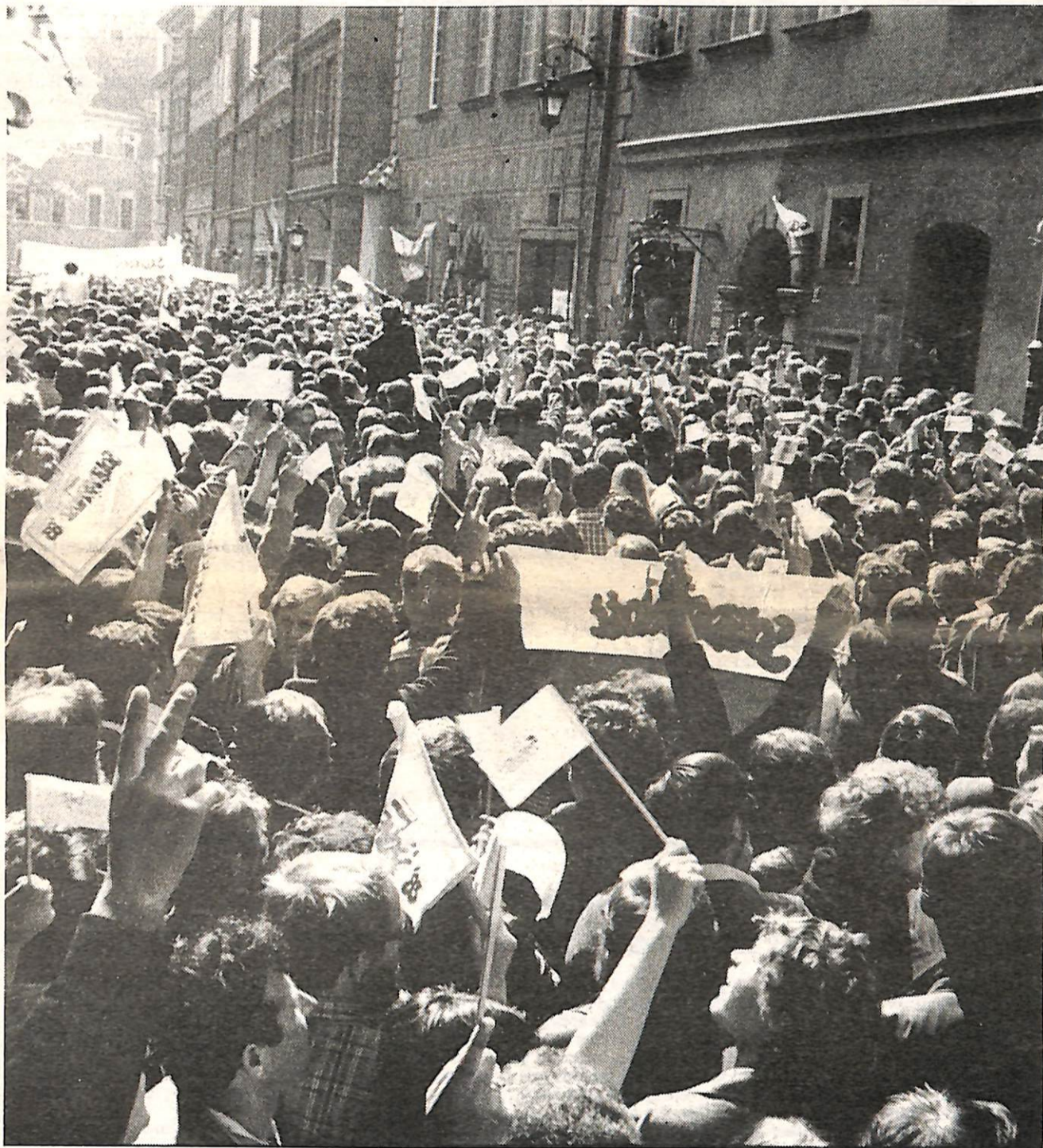
Le 1 er mai 1983 à Varsovie.