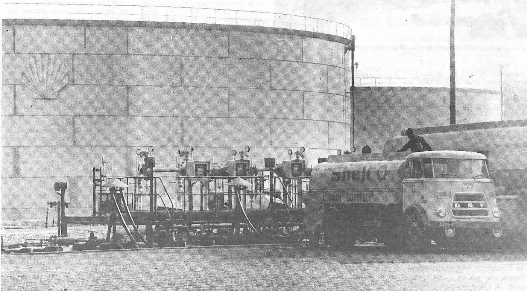
Une raffinerie de Shell, l'une des sept plus importantes compagnies pétrolières du monde.

Si l'on regarde de près l'évolution des prix du baril de brut, on s'aperçoit qu'entre le 20 janvier 1972 et le 16 octobre 1973, l'OPEP a manié