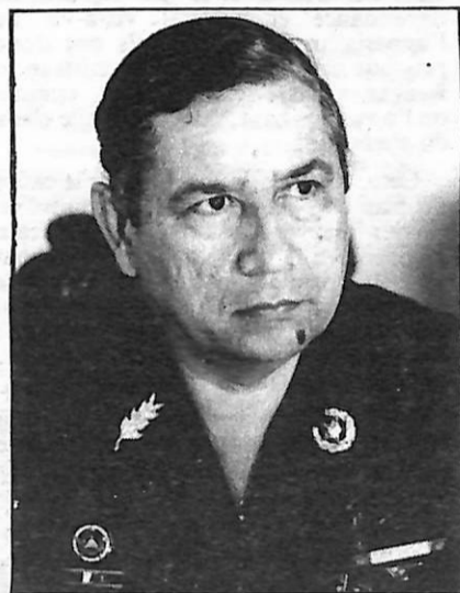
Le général Garcia.

Le même personnage, qui avait salué avec effusion la farce électorale du 28 mars 1982, demandant à la guérilla de déposer les armes et de s'incliner devant cette manifestation éclatante du jeu démocratique, expliquait le 17 avril 1983 « qu'il convenait d'évaluer les élections du 28 mars 1982 (qui ont entraîné la « victoire » du parti du major d'Aubuisson) afin d'éviter de nouveaux échecs ».