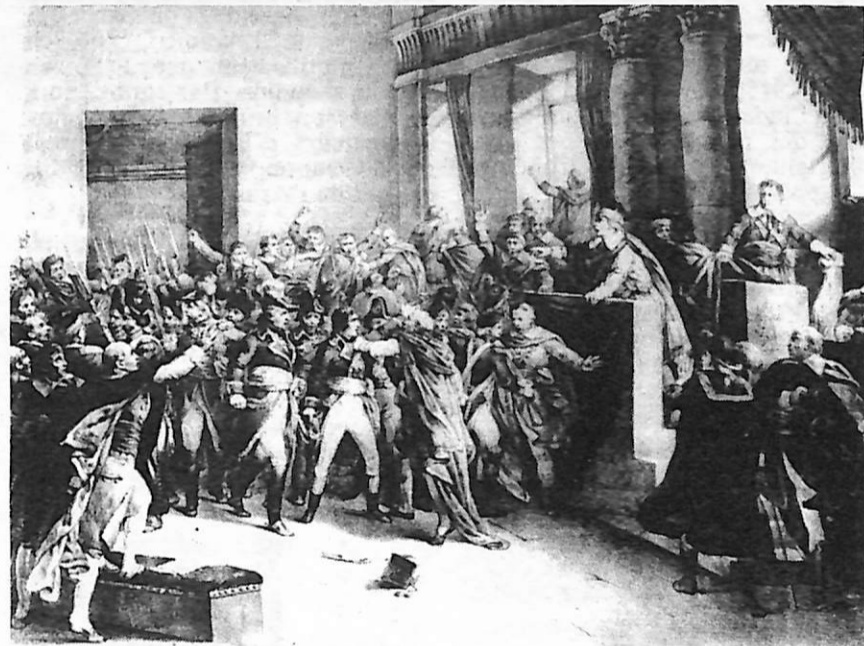
Le coup d'Etat de Bonaparte au Conseil des cinq cents, le 17 novembre 1799.

par une crise majeure, elle abandonne à un homme et, à travers lui, à un appareil militaire et administratif, le pouvoir politique pour sauvegarder son pouvoir économique de classe dominante. C'est cela l'essence du bonapartisme. Menacée en 1799 par la poussée égalitariste et communiste des travailleurs manuels et par la volonté de restauration des royalistes, la bourgeoisie du Directoire dont le porte-parole Sieyès disait « Je cherche un sabre », passe la main au général Bonaparte.