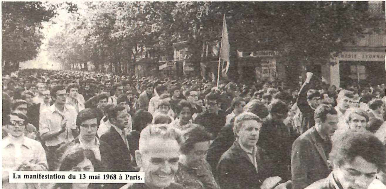
La manifestation du 13 mai 1968 à Paris.

« anciens combattants », soldats perdus ou jeunes loups arrivés, pour marquer combien ce passé est révolu. Et si l'on fait la part belle aux murs de la Sorbonne, au « rêve » et, disons le mot, à « l'utopie » que l'on abomine, n'est-ce pas parce qu'il faut enfouir dans le passé les dioxines dangereuses pour l'ordre social ?