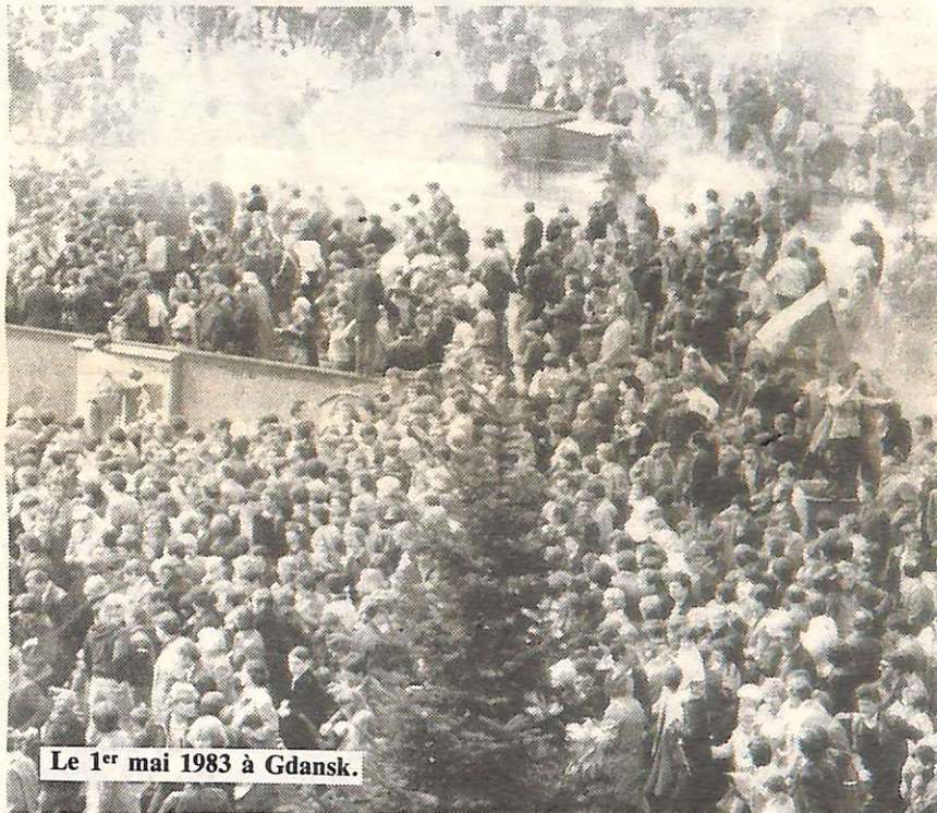
Le 1 er mai 1983 à Gdansk.

La bureaucratie du Kremlin ne s'y trompe pas. Elle rompt le silence qu'elle avait observé depuis plusieurs mois. Par l'entremise de l'une de ses publications Temps nouveaux , elle tance implicitement le gouvernement de Jaruzelski pour sa modération, en accusant une publication contrôlée par Rakowski (le second de Jaruzelski) de céder à l'idéologie « anti-socialiste ».