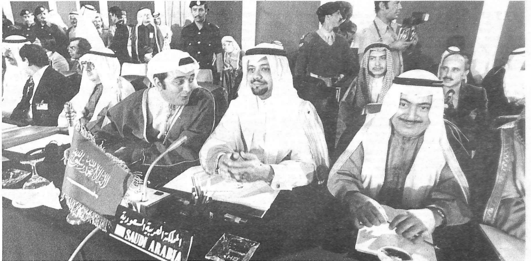
Réunion de l'OPEP.

Le fait que cinq des sept « majors », c'est-à-dire Exxon, Mobil, Texaco, Gulf et Socal, soient américaines, les deux autres étant anglo-hollandaise, la Royal Dutch-Shell, et britannique, BP, a