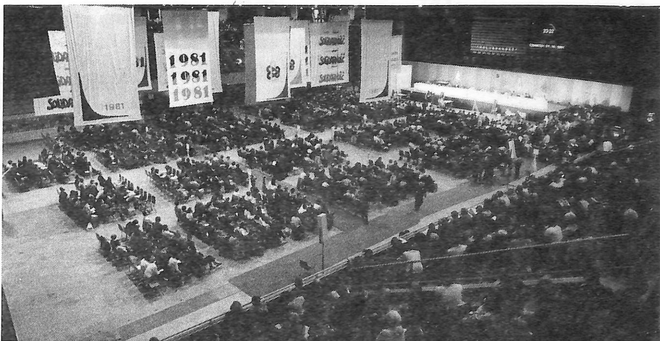
Le congrès de Solidarité.

A l'instigation de l'Eglise, Walesa a déclaré : « Finissons-en avec la voie incertaine de la confrontation, laissons le gouvernement gouverner et le parti en paix. » (Le Monde du 17 juin 1981). Face à l'aggravation de la situation économique, il a prôché la paix sociale et revendicative. Mais il n'y a pas d'« espace » de ce genre. L'organisation du prolétariat comme classe, la constitution de ses organisations indé-