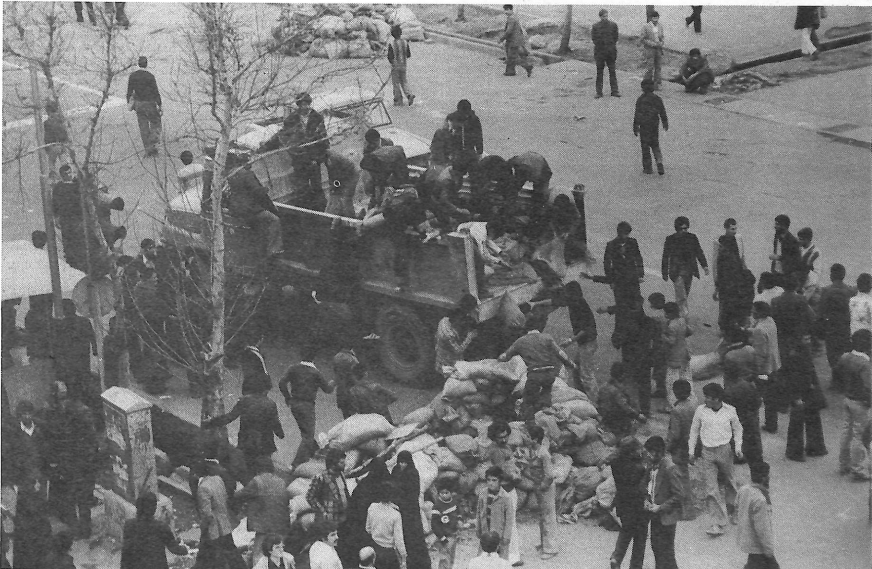
Téhéran, février 1979 : chute du chah. La révolution iranienne a signifié un sérieux coup à l'impérialisme dans un de ses bastions stratégiques et conserve sa pleine actualité

C'est à cette dimension européenne et mondiale qu'il faut apprécier la révolution polonaise, la révolution politique.